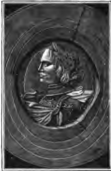
МЕДАЛЬОНЪ ПЕТРА I, ПОЖАЛОВАННЫЙ АРХАНГЕЛЬСКОМУ КУЩУ Д. БАЖЕНИНУ.

(См. «Русскую Старину» изд. 1887 г., т. LVI, ноябрь, стр. 564).