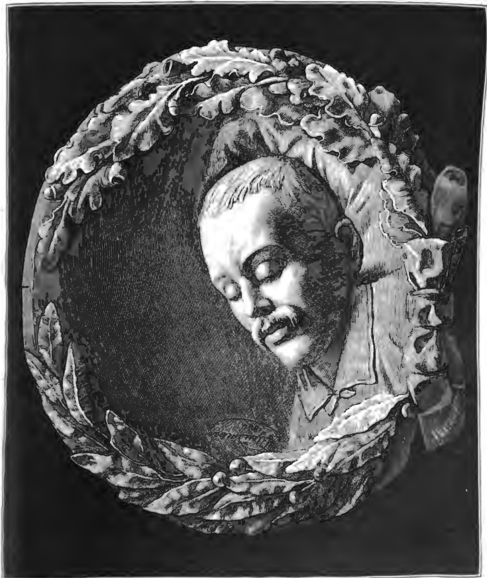
МИХАИЛЬ ЮРЬЕВИЧ ЛЕРМОНТОВЪ